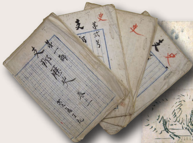
左/正岡子規筆 講義ノート(法政大学図書館所蔵)

1883(明治16)年に上京した子規・真之は、共立学校などの学校で勉学に励み、東京大学予備門に入學します。東京には、全国から優秀な若者たちが集まり、彼らは、勉強だけでなく、寄席などの娯楽や野球のよゆうな新しいスポーツに触れ、近代的な東京の文化を満喫しました。彼らは書生とよばれ、その熱気あふれる活動は、独特な文化を生み出します。 今回の展示では、子規・真之の青春時代の教育や生活、人びととの交流をみていくなかで、書生とよばれた明治の若者たちの実像に迫ります。