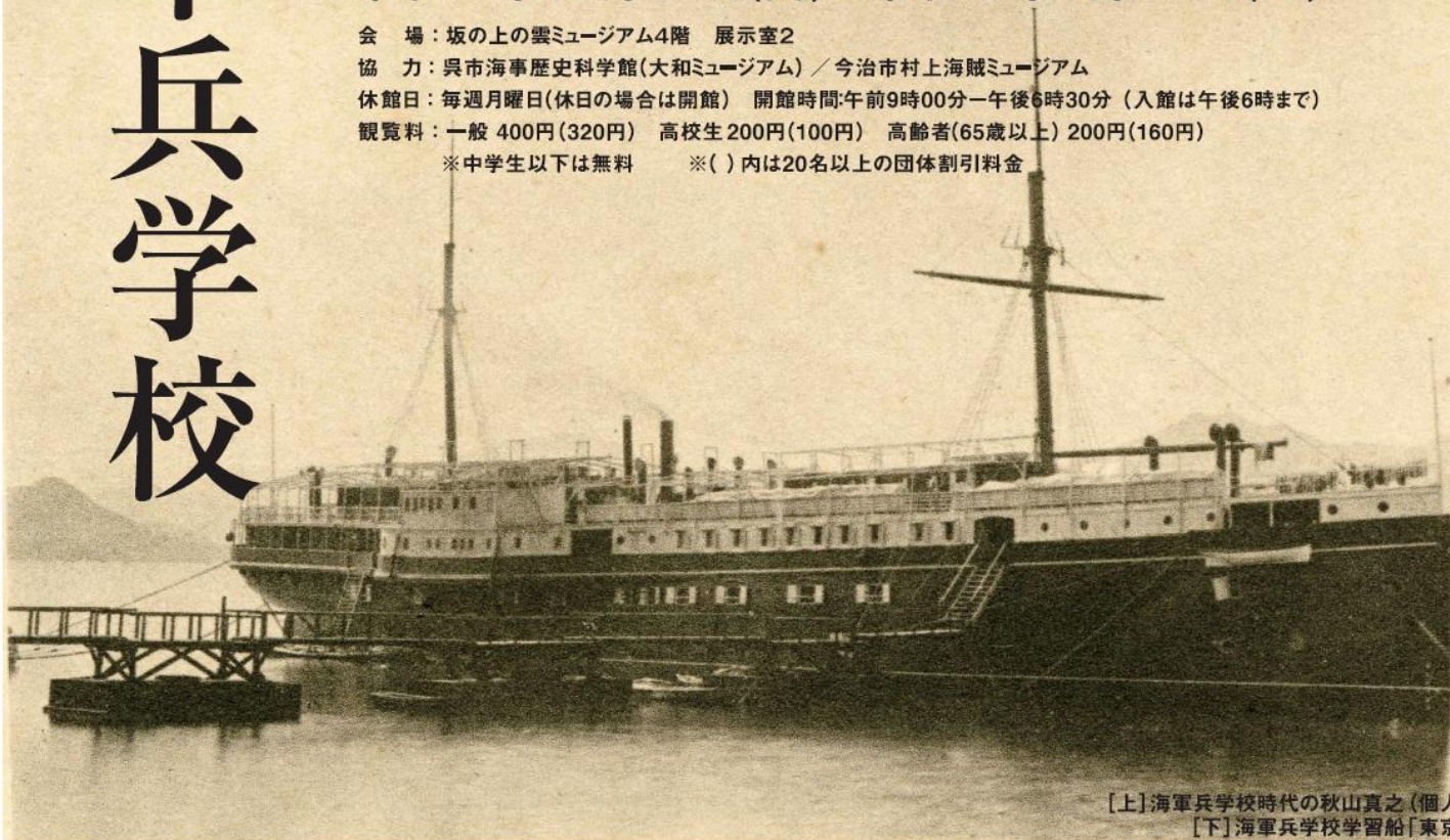
【上】海軍兵学校時代の秋山真之