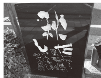
智内さんが筆をふるった子規の詩碑

松山といえば、俳句。道行けば……、いたるところに松山ゆかりの俳人、正岡子規、夏目漱石、種田山頭火などの俳句を石に彫り込んだ句碑が点在し、その数は約200基ともいわれるほどです。句碑に刻まれた言葉に心を寄せ、道を歩けば、見慣れた景色も四季折々にドラマチック。