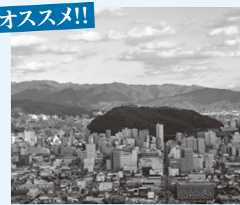
フライブルク城から見る松山市街地

園内には椿をはじめとする多くの花木があり、年中楽しめます。フライブルク城からは、市内が一望できます。