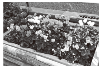
間伐材で造られたという「子規の花通り」の花壇