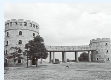
展望塔(通称フライブルク城)