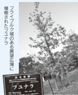
フライブルク城のある展望広場に植樹されたフユナラ