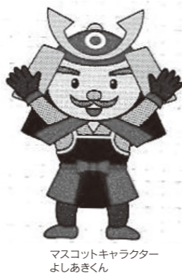
マスコットキャラクター よしあきくん

「松山ひじき」の最大の特徴は、パックを開けてそのまま使えるという手軽さ。水戻しや加熱は不要で、シャキシャキした歯ごたえや風味が評判です。主な産地は松山市沖の興居島、中島などの忽那諸島。美しい瀬戸内海の磯でのびのび育