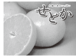
1月中旬から3月中旬が旬の高級カンキツ「せとか」

ち、地元の人たちの手で刈り取られたものです。加工場では煮沸後、砂や貝殻などを取り除く工程が11回もあり、安心です。カルシウムや食物繊維等が豊富で、カルシウムは牛乳の約13倍もあり、市内の学校給食に取り入れられています。また、ヒジキの茎、芽がパランスよく配合され、サラダにするとシャキシャキとした歯ごたえ。しそ風味のふりかけタイプもあり、卵焼きやおむすびの具にもぴったりです。