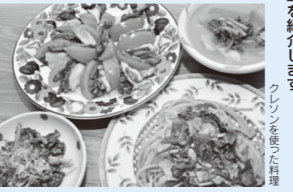
クレソンを使った料理

春になるとあちらこちらで新しい命の芽生えを感じる。山菜が挙げられます。山菜は古くから野菜と同じように食べられ、自然が与えてくれた恵みのひとつです。