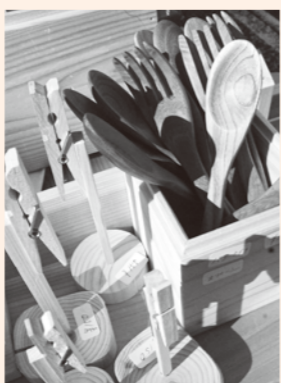
ぬくもりのある木製雑貨

北条地区の「風早楽市」に行ってきました。JR北条駅前通りが歩行者天国となり、約20店舗が軒をつらねます。そのなかには、手作り雑貨のお店、唐揚げ、パン、おにぎりなどの食べ物のお店、日用品のセールなど、の店があり、小さなライブステージもありました。