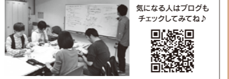
気になる人はブログもチェックしてみよう!

ブログ http://blog.livedoor.jp/mtnp 「まちづくり!!まつやま新聞編集部」