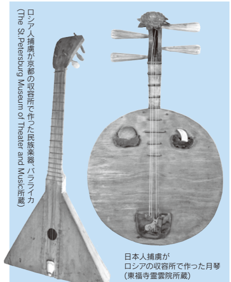
ロシア人捕虜が京都の収容所で作った民族楽器「バラライカ」(The St.Petersburg Museum of Theater and Music所蔵)