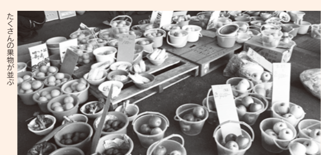
たくさんの果物が並び

べつたん、べつたんとは餅つきの軽快な音。松山市総合コミュニティセンターで行われている「きまぐれ市」は、60以上のお店が並び、お客様の数も百人単位です。会場は、コミュニティプラザ、空の広場、風の庭の3つで構成されており、大人も子どもも楽しめます。生産者がこだわって