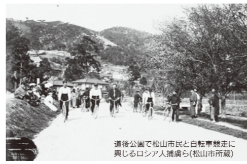
道後公園で松山市民と自転車競走に興じるロシア人捕虜ら

ハーグ万国国際会議の歴史、捕虜生活、調査した国際法学者の活動などを紹介。収容所で捕虜が手作りし、心を支えたとされる楽器なども展示されます。