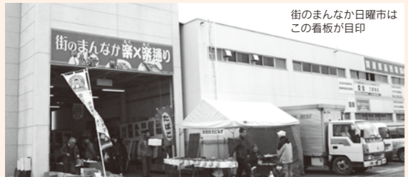
街のまんなか日曜市はこの看板が目印

回数を重ねることに来場者が増えている今、人気急上昇中の街のまんなか日曜市。久万ノ台にある中央卸売市場で行われて、います。駐車場も完備されているので行きやすいですね。入り口の大きな看板が目印です。市場の商店街のようなところで食べ物がたくさん売られています。食べ物以外にも、手作りのビーズの雑貨、アクリル