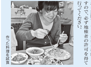
作った料理を食す

②クレソンとベーコンのベーコンチノ。オリーブオイルでベーコンを炒め、茹でておいた Pasta と市販