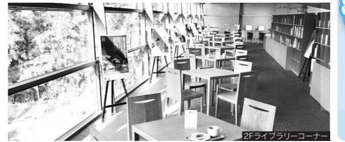
2Fライブライリーコーナー

2Fが無料というのは分かったけれど、じゃあ2Fに何かあるの？というところですが、紹介してきましたライブライリーコーナーの他に、ホールとカフェがあります。ホールでは毎月、コンサートやリレー朗読会など楽しいイベントの他、さまざまな展示も行っていきます。カフェでは、オリジナルのブレンドコーヒーをご用意しています。松山中心部の癒しのスポットとして皆様のご来館、ご利用を心からお待ちしております。どうぞお気軽にお越しくださいませ。