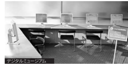
デジタルミュージアム ブレンドコーヒーとお菓子のついた「ミュージアムセット」

例えば、小説の主人公をはじめとする登場人物が成し遂げたことや、一生について調べることができます。人物だけでなく、俳句や明治時代の松山の様子、ロシア人墓地についても調べることができます。テーマは無限大。スタッフも相談ののってくださるので、百人力です。