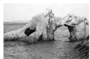
これは石門と呼ばれる、ちょっと珍しい形をした岩です。夏になったらぜひ、くぐってみてください!