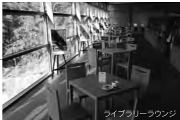
ライブラリーラウンジ

平成23年3月1日(火)から平成24年2月下旬まで4階展示室で、第5回企画展「日露戦争と明治のジャーナリズム」のバルチック艦隊と真之が開催されます。是非ご来館ください。(観覧には観覧料が必要です) 問:坂の上の雲ミュージアム ☎(089)915-2600