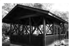
当時の石垣はそのまま。頂上に登るまでの休憩にちょうど良いです。木漏れ日が心地良い!

海を渡り、約1分。そこには心を癒す場所がある。昔ながらの風貌に、感じることは人それぞれ。今ここで鹿島のパワーを再発見!