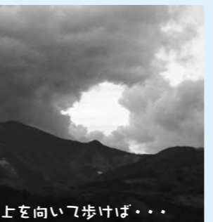
上を向いて歩けば・・・