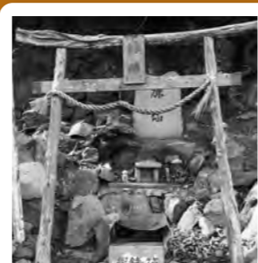
鹿島には縁結びの神様がいらっしゃいます。ユニークな男女の性器のような形をした祠が置かれてありました。縁起を担いでカップルにおすすめ!