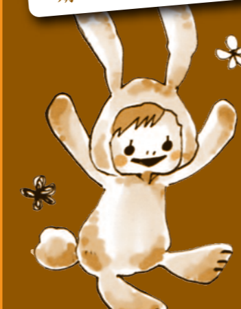
ただひたむきに...(T・K/20歳)