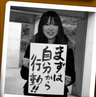
まずは自分から(A・M/21歳)