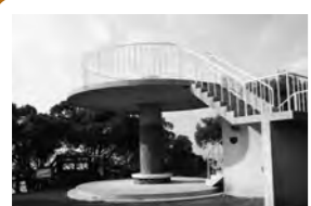
頂上まで登ると絶景が!展望台からは伊予の二見と夫婦岩が見られます。隠れたデートスポットです!