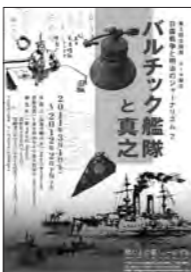
バルチック艦隊と真之

平成23年3月1日(火)から平成24年2月下旬まで4階展示室で、第5回企画展「日露戦争と明治のジャーナリズム」のバルチック艦隊と真之が開催されます。是非ご来館ください。(観覧には観覧料が必要です) 問:坂の上の雲ミュージアム ☎(089)915-2600