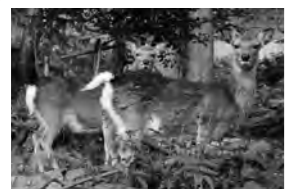
鹿島にはたくさんの鹿がいます。中でもおしりにハートマークが2つ付いている鹿がいるので、ぜひ探してみてください!何かいいことあるかも!?